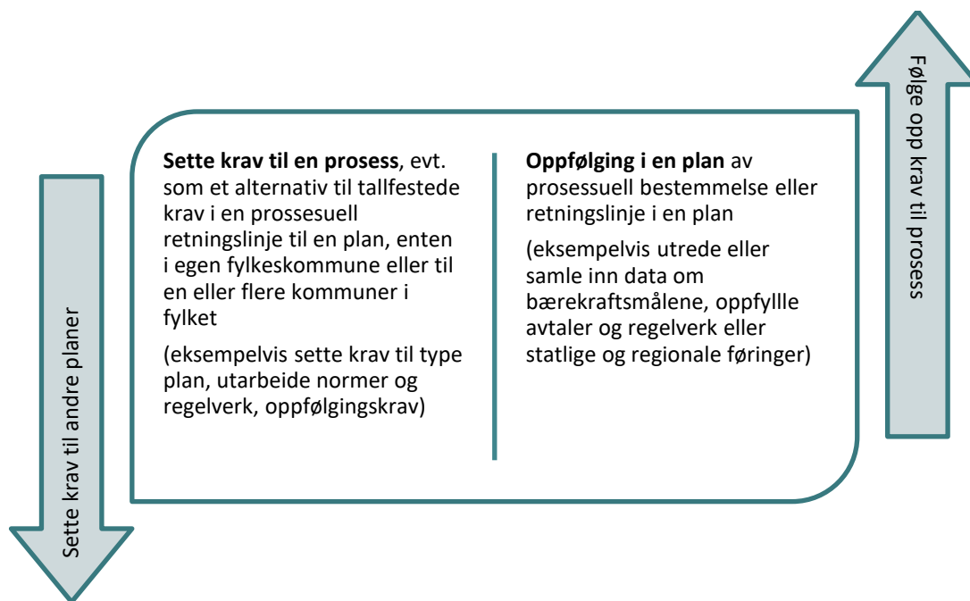
Tabell S2: Bruk av prosessuelle retningslinjer i planlegging for å oppfylle eller sette krav til prosesser.

Vi har brukt begrepet 'prosessuelle retningslinjer' om retningslinjer som er utformet som et krav som gis i en plan for å løse en problemstilling gjennom en prosess på et senere tidspunkt, eller ved et utredningskrav som kan løses på et annet plannivå eller i en annen type plan, se figuren S2.