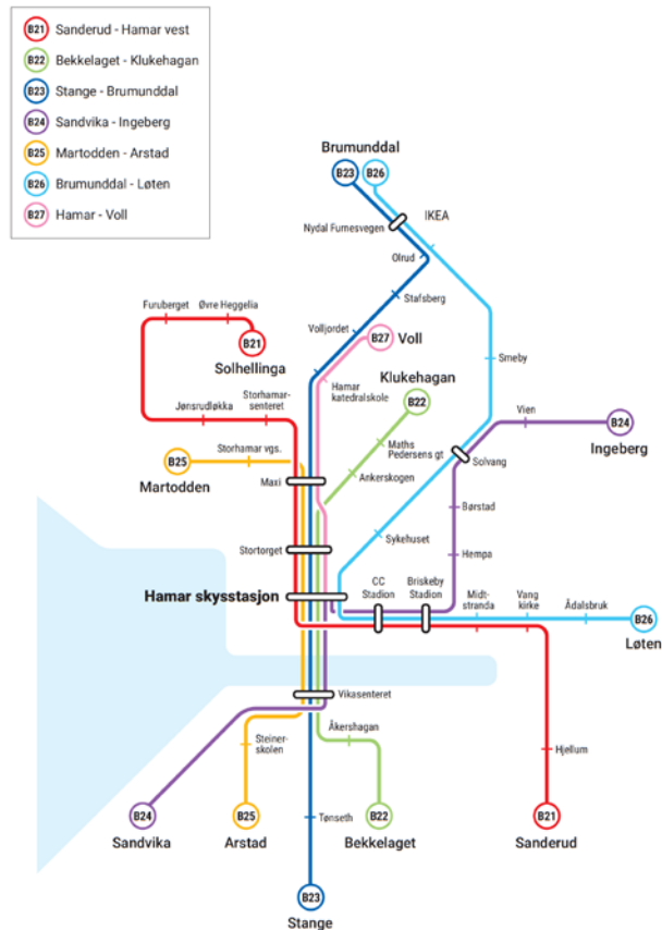
Figur 3: Kartet viser rutestrukturen fra 2020 som bygger videre på prinsippene om enkel og effektiv rutestruktur.