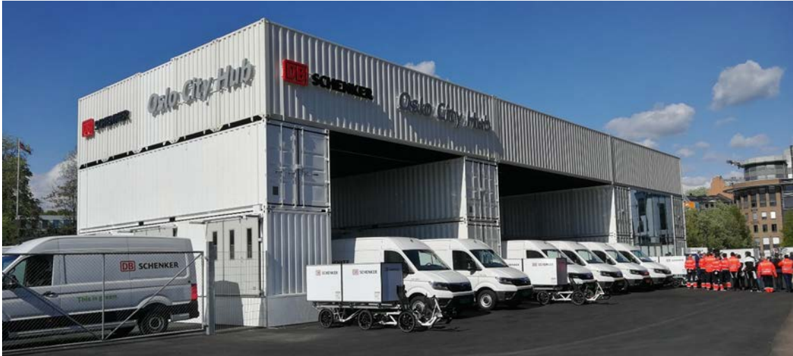
Figur S.1: Oslo City Hub fra den offisielle åpningen av huben 8.mai 2019.

Oslo City Hub består av flere containere satt sammen til en konstruksjon som muliggjør en fleksibel og midlertidig løsning med en lav investeringskostnad. I forbindelse med utformingen av Oslo City Hub har det blitt avholdt flere og jevnlige prosjektmøter for å diskutere skisser og løsningsforslag. I følge både prosjektpartnerne og DB Schenker har det vært avgjørende å ha med brukeren av Oslo City Hub med deres ekspertkunnskap i utformingsfasen av bylogistikkdepotet. Figur S.1 viser endelig konstruksjon på Oslo City Hub tatt fra den offisielle åpningen 8.mai 2019.